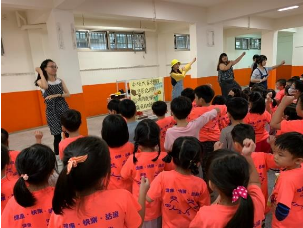
複習中秋節台語唸謠