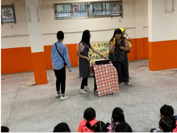
介紹中秋節相關台語詞彙